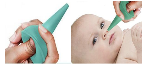
شکل ۱: روش استفاده از پیوار